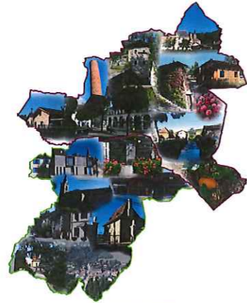
Plan 1/4 : Zonage