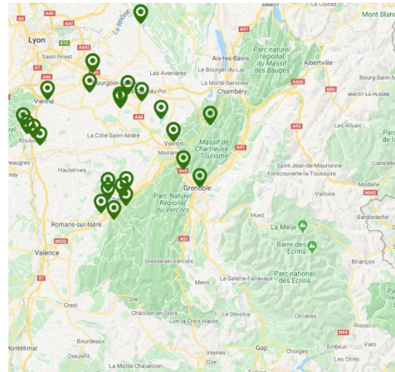
Carte : Nids confirmés de frelon asiatique sur le département de l'Isère en 2019

Les conditions climatiques de l'année semblent avoir été défavorables au prédateur. Malgré tout, le frelon asiatique continue sa progression.